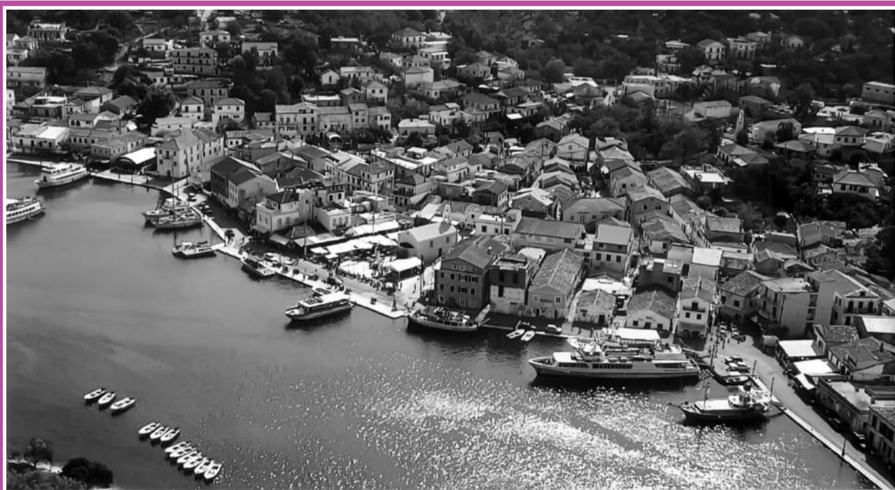
Γενική άποψη του Γαίου

Για την έρευνα Γ. Λύχνος