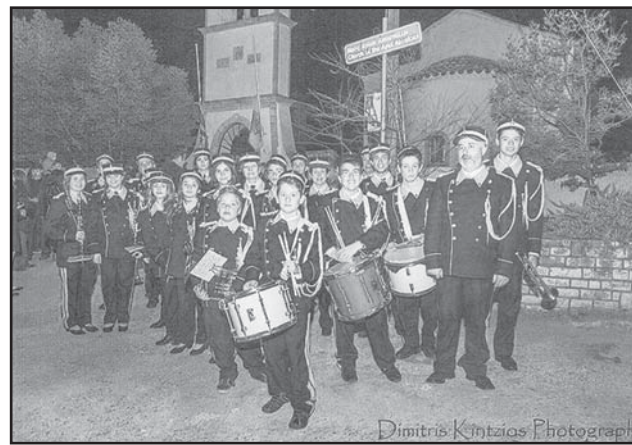
Η Φιλαρμονική του Δήμου Παξών σε αναμονή του Επιταφίου των Αγίων Αποστόλων Γαίου την Μ. Παρασκευή 10/4/2015