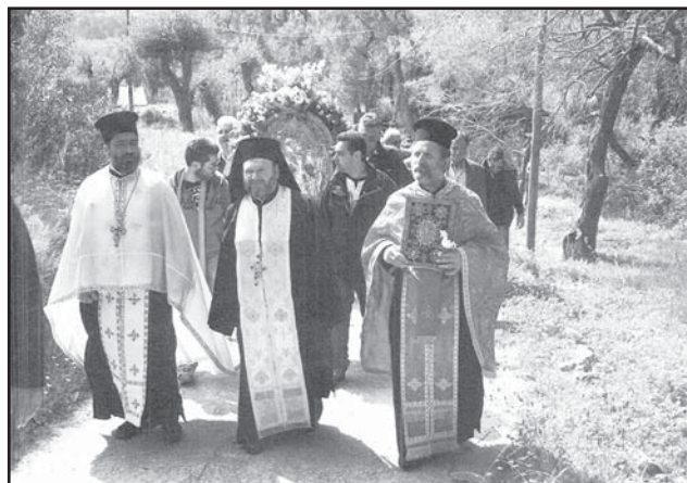
Η λιτανεία της Υπαπαντής στην Λάκκα την Νια Δευτέρα 13/4/2015