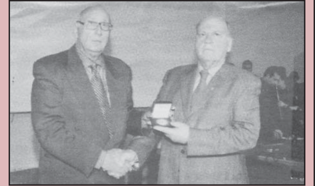
Η ΕΑΑΣ τιμά τον πρόεδρο της χορωδίας των απανταχού Παξινών

Στην εφημερίδα «Εθνική Ηχώ» της Ένωσης Αποστράτων Αξιωματικών του Στρατού και στο άρθρο του Υποστράτηγου ε.α. Ιωάννη Δαφνή, υπάρχει αναφορά για την εμφάνιση της χορωδίας μας στην εκδήλωση της ΕΑΑΣ για την 193η Επέτειο της Εθνικής μας παλιγγενεσίας, στο Πολεμικό Μουσείο στις 23-3-2014 και τα ευμενή σχόλια που απεκόμισε για την ακόμα μια φορά άψογη εμφάνισή της.