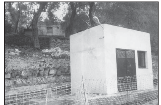
Στα Μαγαζιά, το Αντλιοστάσιο στην Βαγγελίστρα

Ελπίζουμε λοιπόν ότι μετά την ολοκλήρωσή τους θα έχουν κάτι να πουν και να δείξουν για την καλύτερευση του περιβάλλοντος.