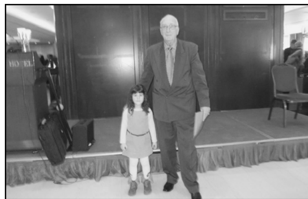
Η ΜΙΚΡΟΥΛΑ ΠΟΥ ΒΡΗΚΕ ΤΟ ΦΕΤΙΝΟ ΦΛΟΥΡΙ ΜΕ ΤΟΝ ΠΡΟΕΔΡΟ ΤΗΣ ΕΝΩΣΗΣ.

Από τους συνεργάτες του συμπατριώτη μας Υπουργού Προστασίας του Πολίτη Νίκου Δένδια πληροφορούμαστε ότι τα Υδροπλάνα θα μπουν στους Παξούς, μετά τις σχετικές διορθώσεις στο Ν/Σ, προκηρύχθηκε η θέση για μικροβιολόγο στο