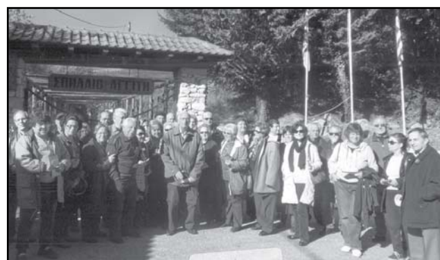
10/11/12. Στην είσοδο του Σπηλαίου «Αγγίτη»

Μετά ξεναγηθήκαμε στο υπόλοιπο κομμάτι των Φιλίππων που κρατάει περισσότερο από την χριστιανική εποχή. Είναι