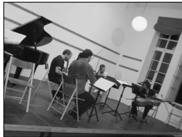
ΦΩΤΟ ΑΠΟ ΤΟ ΕΑΡΙΝΟ ΦΕΣΤΙΒΑΛ ΠΑΞΩΝ 2012 (ΠΟΥ ΕΓΙΝΕ ΜΕΤΑ ΑΠΟ ΑΝΑΒΟΛΗ ΛΟΓΩ ΤΩΝ ΕΚΚΛΟΓΩΝ) ΣΤΗΝ ΑΙΘΟΥΣΑ ΕΚΔΗΛΩΣΕΩΝ ΛΟΓΓΟΥ (ΠΑΛΙΟ ΣΧΟΛΕΙΟ) ΔΡΩΜΕΝΑ ΣΥΓΧΡΟΝΗΣ ΜΟΥΣΙΚΗΣ 26,27,28,29,31 ΑΥΓΟΥΣΤΟΥ ΠΑΝΗΓΥΡΙΚΗ ΣΥΝΑΥΛΙΑ 30 ΑΥΓΟΥΣΤΟΥ

Με βαθιά εκτίμηση Θωμάς Αντίοχος (Λιλιάς)