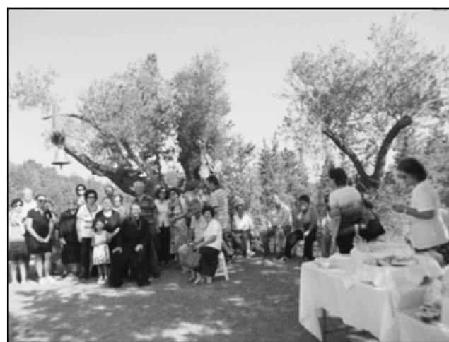
ΣΤΙΣ 24/8 ΕΓΙΝΕ ΜΙΑ ΜΙΚΡΗ ΓΙΟΡΤΗ ΣΤΗΝ ΑΝΑΛΗΨΗ ΣΤΗΝ ΠΛΑΚΩΤΗ