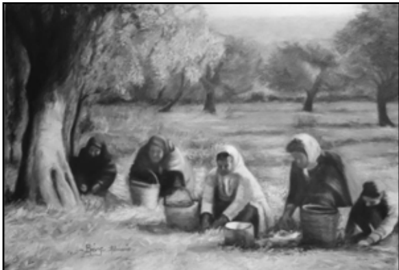
ΕΚΘΕΣΗ ΖΩΓΡΑΦΙΚΗΣ ΑΘΑΝΑΣΙΑΣ ΒΡΕΝΤΖΟΥ 10/8/12-20/08/12