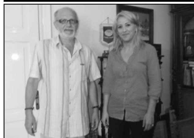
ΦΩΤΟ ΑΠΟ ΤΗΝ ΕΠΙΣΚΕΨΗ

ΤΗΣ ΡΕΝΑΣ ΔΟΥΡΟΥ ΣΤΟ ΔΗΜΟ ΠΑΞΩΝ Ο ΔΗΜΑΡΧΟΣ ΠΑΞΩΝ ΣΠΥΡΟΣ ΜΠΟΓΔΑΝΟΣ ΣΥΝΑΝΤΗΘΗΚΕ ΜΕ ΤΗ ΒΟΥΛΕΥΤΗ ΤΟΥ ΣΥΡΙΖΑ ΡΕΝΑ ΔΟΥΡΟΥ ΚΑΤΑ ΤΗ ΔΙΑΡΚΕΙΑ ΤΩΝ ΔΙΑΚΟΠΩΝ ΤΗΣ ΣΤΟ ΝΗΣΙ ΜΑΣ ΚΑΙ ΤΗΝ ΕΝΗΜΕΡΩΣΕ ΓΙΑ ΤΑ ΤΡΕΧΟΝΤΑ ΖΗΤΗΜΑΤΑ ΤΟΥ ΝΗΣΙΟΥ ΚΑΙ ΤΗΣ ΠΕΡΙΟΧΗΣ ΜΑΣ.