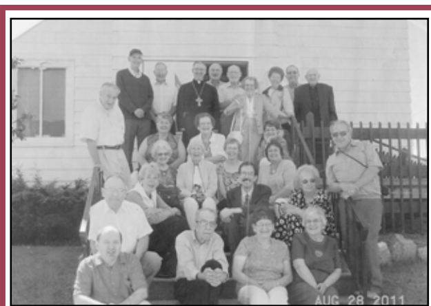
Several families of Greek descent with ties to the Iron Mountain area held a reunion on August 26-28, 2011.

Μερικές οικογένειες Ελλήνων απογόνων που έχουν σχέση με την περιοχή του Αίρον Μάνουντιν, πραγματοποίησαν μια συνάντηση επανασύνδεσης στις 26-28 Αυγούστου 2011. Αρκετοί είναι απόγονοι ιδρυτών της ορθόδοξης εκκλησίας της Αγίας Μαρίας, όπου βγήκε και αυτή η φωτογραφία. Οι παραβρισκόμενοι εξιστόρησαν ιστορίες των ταξιδιών των προγόνων τους στην Αμερική ενώ διασκέδαζαν και απολάμβαναν ένα αυθεντικό ελληνικό γεύμα που ετοίμασε το Ρεστοράν του Σπύρου, στο πικ-νικ που έλαβε χώρα στον χώρο του συγκροτήματος Σόκερ της Αγ. Μαρίας.