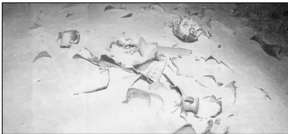
Αγγεία και αμφορείς από τον χώρο του ναυαγίου «Ποσειδών 1», που χρονολογείται κοντά στον 3ο μ.Χ. αιώνα

ναυαγίου φαίνονται αμφορείς, μαγειρικά σκεύη, τουλάχιστον δύο άγκυρες, μέρος από το έρμα του πλοίου και ίχνη από το σκαρί του. Το δεύτερο ναυάγιο εντοπίστηκε σε βάθος 1.375 μ. και χρονολογείται στην ίδια περίοδο με το προηγούμενο. Από το ναυάγιο σώζονται αμφορείς, πινάκια, μαγειρικά σκεύη, καθώς και διάφορα μεταλλικά αντικείμενα, μέρος από το έρμα και πιθανώς το σκαρί του πλοίου. Από το ναυάγιο δεν ανελκύνθηκαν αντικείμενα λόγω της δυσκολίας αποκόλλησής τους από τον λασπώδη πυθμένα. Το τρίτο ναυάγιο, «ΠΟΣΕΙΔΩΝ 3», εντοπίστηκε σε βάθος 1.260 μ. και πρόκειται για πλοίο μάλλον νεότερων χρόνων πιθανώς 17ου-18ου αι. Από το πλοίο σώζεται το σκαρί του, οι σιδερένιες άγκυρες, μαγειρικά και αποθηκευτικά σκεύη και