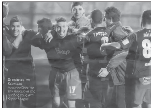
Ο Α.Ο. ΚΕΡΚΥΡΑ παρέμεινε στην Α' Κατηγορία. Συγχαρητήρια και τους ευχόμεστε και του χρόνου περισσότερες νίκες.

Ο Α.Ο. ΠΑΞΟΙ παραμένει στην Α1 Κατηγορία. Συγχαρητήρια στους ποδοσφαιριστές και τους παράγοντες της ομάδας.